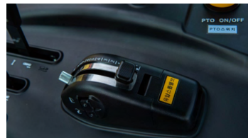
3. 전자 리프트 컨트롤