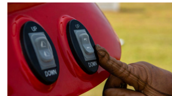
5. 외부 상하강 스위치