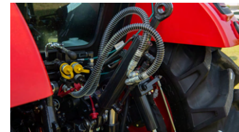
6. 유압식 톱링크