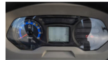
6. Digitales Kombiinstrument