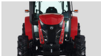
1. Frontpartie im Tiger-Gesichts-Design