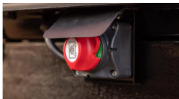
2. Batterieschalter (Abschaltung)