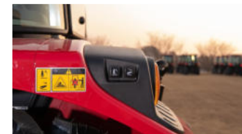
6. Externe Bedientöpfe für die Anhängervorrichtung