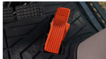
3. Elektronisches Fahrpedal