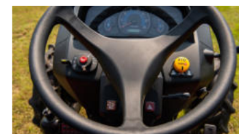
6. Instrumententafel mit hoher Sichtbarkeit