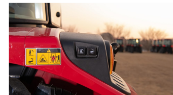
6. Externe Bedienknöpfe für die Anbaukupplung