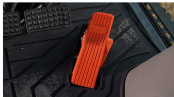
3. Elektronisches Orgel-Pedal