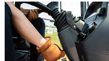
5. 틸트 핸들