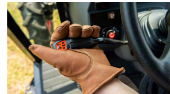
6. 전후진 셔틀레버