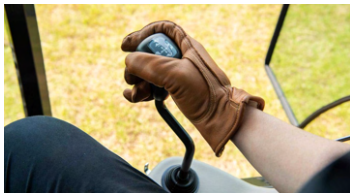
2. 로더 조이스틱 레버