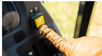
4. PTO 스위치