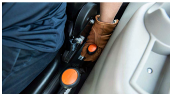
1. PTO 3단