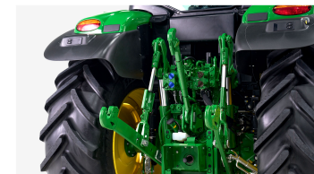
6. 후방 외부 유압밸브