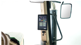
3. 디지털 계기판