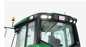
5. 측후방 LED 작업등