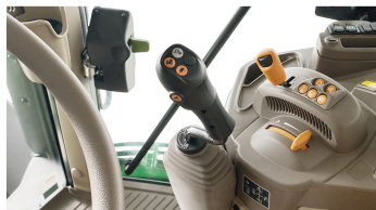
4. 로더 조이스틱