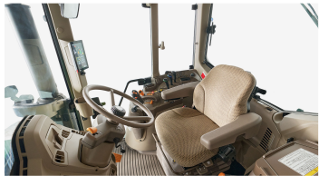
1. 캐빈 내부