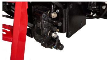
3. 전방 외부 유압 6포트