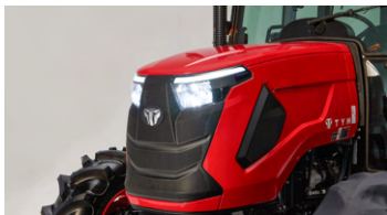
1. 세련된 후드 디자인