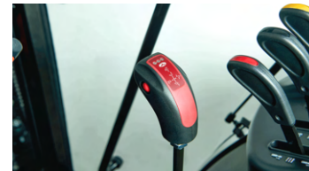
6. 고급형 로더 조이스틱 레버