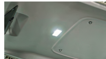
5. LED 실내등