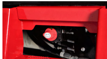
4. 배터리 차단 스위치