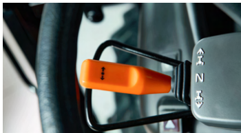
2. 파워 셔틀