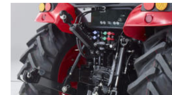
6. Hydraulischer Oberlenker