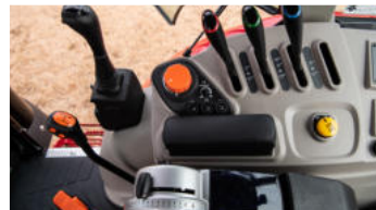
3. Ergonomisches Bedienzentrum