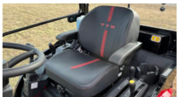
2. Komfortabler Federungsitz