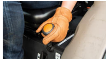
3. Ergonomischer Hebel