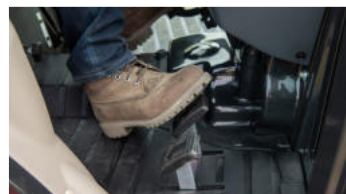
4. Hochreaktiver Vorwärts- & Rückwärts-HST (T3048 (F50CHN))