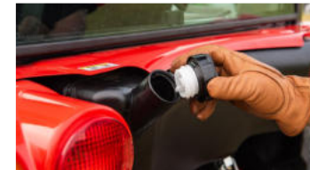
5. Kraftstofftank mit hoher Kapazität