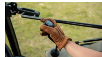
6. Kreuz-Hebel für Frontlader