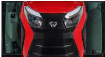
1. Neue ikonische Motorhaube