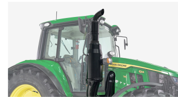
5. 대용량 SCR 배기 파이프