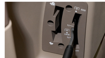
6. 3단 PTO