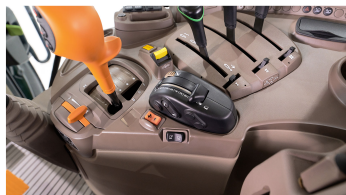
4. 전자 리프트 컨트롤