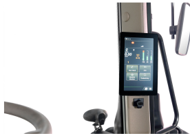
3. 디지털 계기판