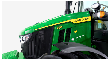
1. 경사형 후드 디자인