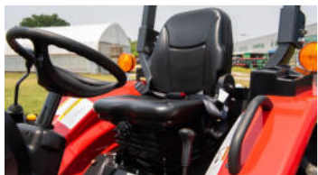
2. Komfortabler Federungssitz