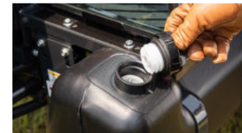
5. Kraftstofftank mit hoher Kapazität