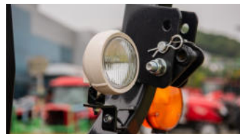
4. Arbeitsleuchte hinten