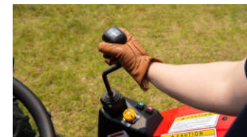
6. Kruez-Steuerung für Frontlader