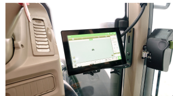
4. G5 모니터