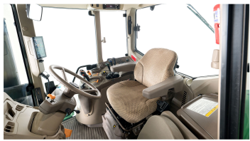
1. 캐빈 내부