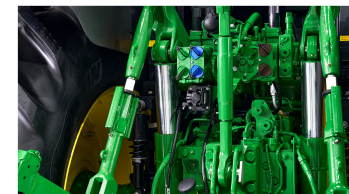
6. 후방 외부 유압밸브