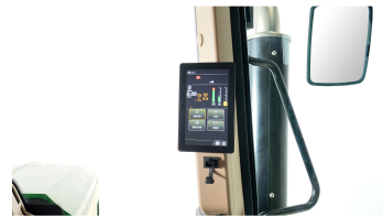
3. 디지털 계기판