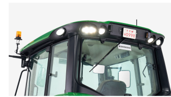
5. 측후방 LED 작업등