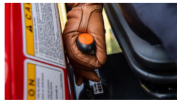
3. Ergonomischer Hebel