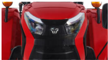
1. Neue, markante Motorhaube