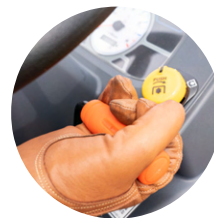
4. 스로틀 레버