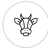
양계 · 축산