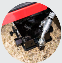
1. 로더 링크 장치