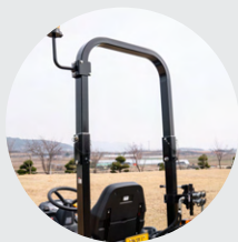
3. 접이식 ROPS