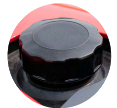
6. 대용량 연료 탱크