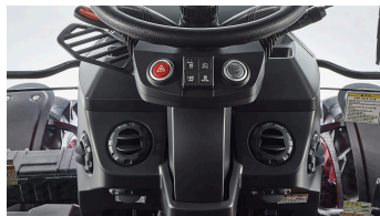
4. 하부 배치형 HVAC 시스템