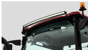
3. 파노라마 LED 작업등