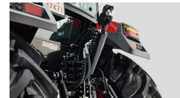
5. 유압식 톱링크