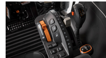
6. 기능형 암레스트