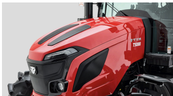
1. 차세대 후드 디자인