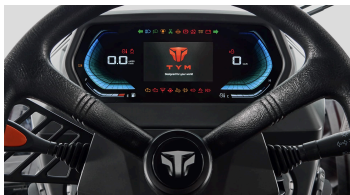
2. 국내 최초 풀 세그먼트 LCD 계기판