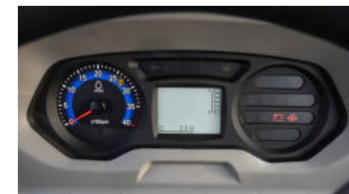
6. Digitales Instrumentenfeld