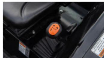
4. 3-Stufen-HST & 8V x 8R Getriebe