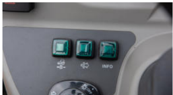
1. Schalter für Tempomat (nur HST)