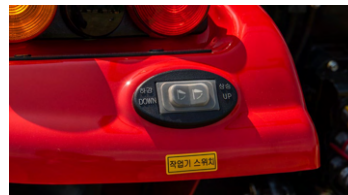
3. 작업기 승하강 스위치