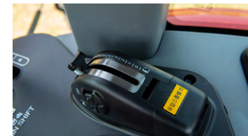
5. 전자 리프트 컨트롤