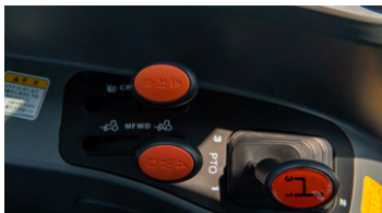
1. 부변속/ 초저속/4WD레버