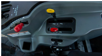
2. 후방 작업기 조절 레버