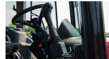
6. 로더 조이스틱