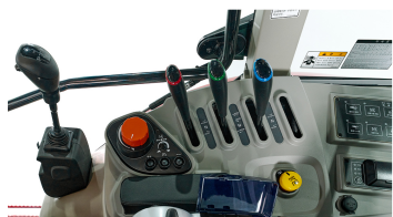
1. 집중식 조작부