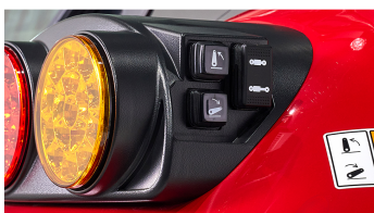
3. 외부 조작 스위치