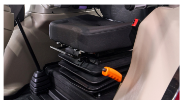
2. 에어 서스펜션 시트