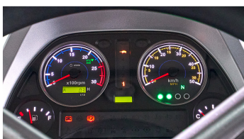
4. 디지털 계기판