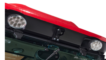
6. 후방 카메라