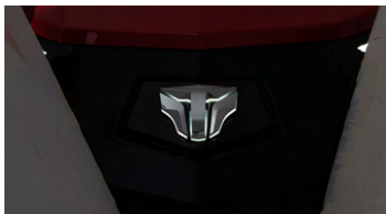
1. LED 엠블럼