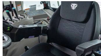
4. 에어 서스펜션 회전 시트