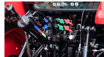
5. 후방 외부 유압 포트 (유압식 톱링크)