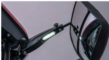
2. LED 듀얼 사이드 미러