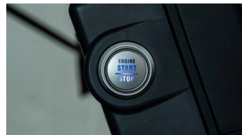
3. 엔진 스타트 버튼