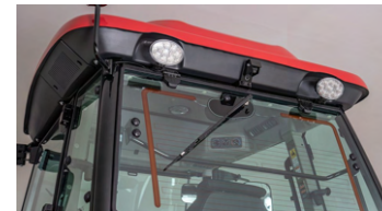
6. 후방 열선 유리