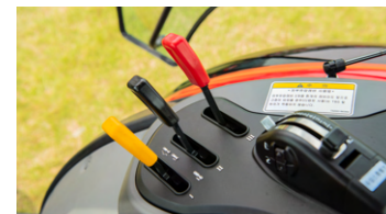
6. 외부유압/포지션 레버