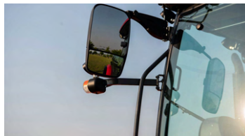
3. 듀얼 사이드 미러