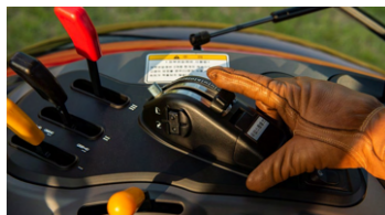
4. 전자 리프트 컨트롤