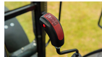
5. 로더 조이스틱