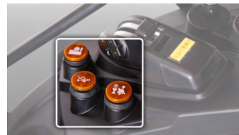
3. 경심 제어 & 회전/후진 상승