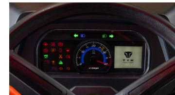
5. 디지털 계기판