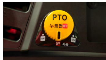
4. 오토 PTO