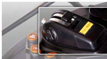
2. 전자 리프트 컨트롤