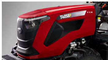
1. 패밀리룩의 세련된 후드 디자인