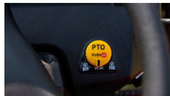
3. PTO 스위치