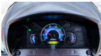
2. 디지털 계기판