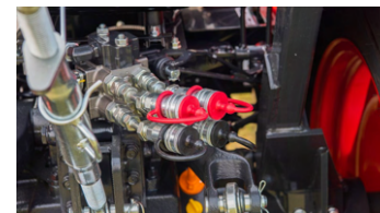
6. 후방 외부 유압 밸브