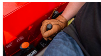
4. 외부 유압 조작 레버