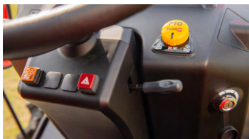
1. 틸트 핸들