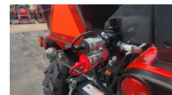
6. 2-facher Heck-Hydraulikanschluss (optional)