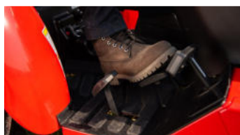
4. Sehr reaktionsschnelle Vor-/Rückwärts-HST (T2026 (2500HL))