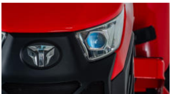
1. Neue, markante Motorhaube