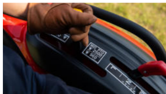
3. Ergonomischer Hebel