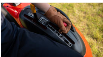
2. Untersetzung (3 Gruppen, T2026 (2500HL))