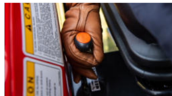
3. Ergonomischer Hebel