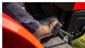
4. Reaktionsschneller Hydrostat-Antrieb