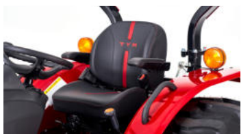
2. Komfortabler luftgefederter Sitz