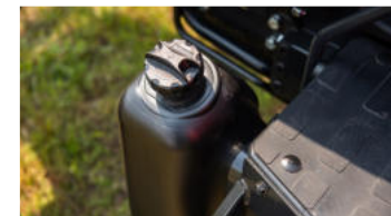
5. Kraftstofftank mit großer Kapazität