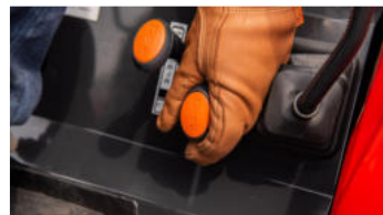
3. Ergonomischer Hebel