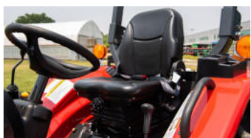
2. Komfortabler Federungsitz