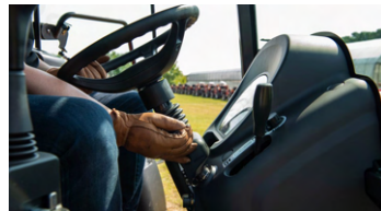
4. 틸트 핸들