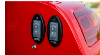
5. 작업기 상하강 스위치