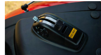
6. 전자 리프트 컨트롤